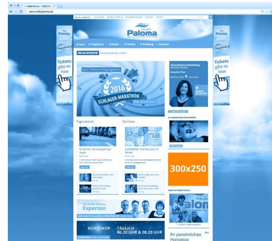
RECTANGLE (MEDIUM) Maße 300x250 Pixel