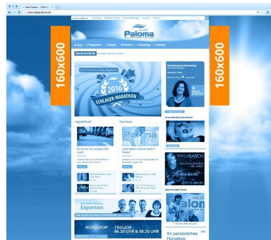
WIDE SKYSCRAPER Maße 160x600 Pixel