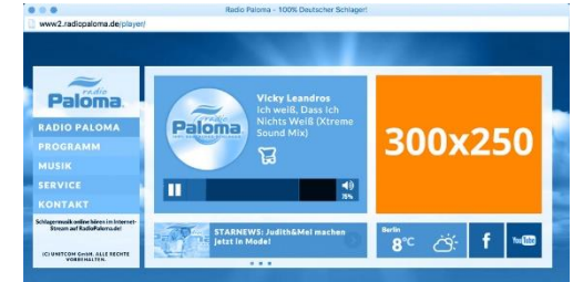
RECTANGLE PLAYER Maße 300x250 Pixel

Schematische Darstellung, die genaue Platzierung kann abweichen