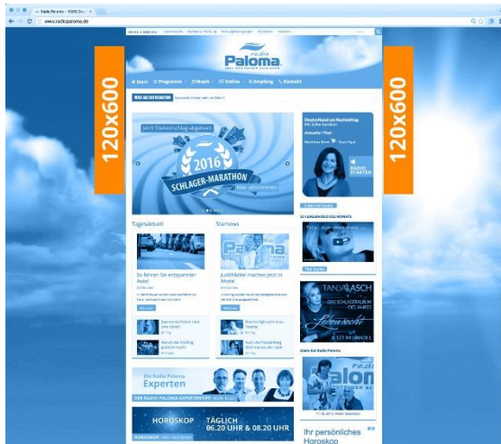
SKYSCRAPER Maße 120x600 Pixel